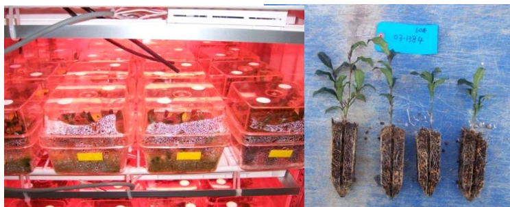
図4 光独立栄養培養法を用いた苗の生産

左: 高二酸化炭素条件で、1葉1芽の枝から発根させる。 右: 発根した苗をプラグに移植し、馴化・育苗する。