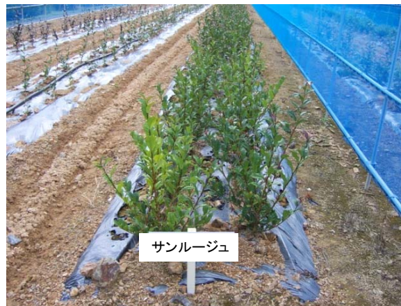
図5 定植後1年目の生育状況

左: 高二酸化炭素条件で、1葉1芽の枝から発根させる。 右: 発根した苗をプラグに移植し、馴化・育苗する。